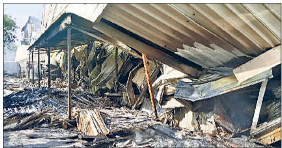
रेवाड़ी। कंपनी में आग लगने से जला सामान तथा कंपनी में मौजूद फायर ब्रिगेड व कर्मचारी।