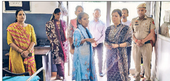
रेवाड़ी। नशा मुक्ति केंद्र का निरीक्षण करती सीजेएम डॉ. रेनु सोलखे।

बिजली-पानी के बिलों तथा राजस्व के मामलों का निपटारा किया जाएगा। सीजेएम ने आमजन से अपील करते हुए कहा कि वे शनिवार को आयोजित होने वाली राष्ट्रीय लोक अदालत के अवसर का लाभ उठाएं। उन्होंने कहा कि कोर्ट में अपर लखित मामलों को आपसी सहमति से हल करा लेने में ही फायदा है, जिससे कि समय कम लगे और मामली खर्च में ही विवाद का निपटारा हो जाए। कोई भी केस में कोर्ट में चलता है तो लोगों को उसके लिए बार-बार चक्कर लगाने पड़ते हैं और धन व समय भी खर्च होता है। लोक अदालत में आदमी आकर विवाद को सुलझा ले तो यह वही समाप्त हो जाता है।