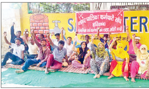
मंडी अटेली। धरने पर बैठे सफाई कर्मचारी।