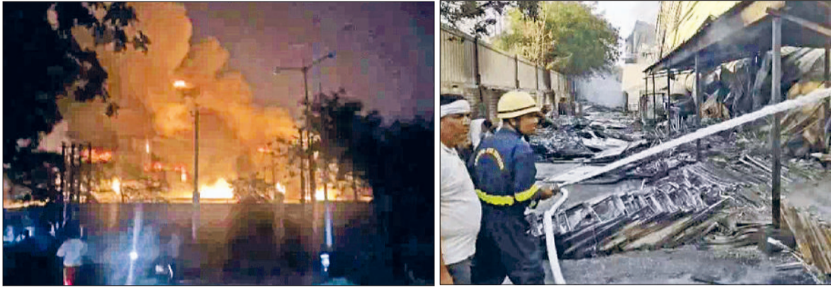
रेवाड़ी। बुधवार देर रात सोलर प्लेट कंपनी में लगी आग तथा कंपनी में लगी आग बुझाते दमकल कर्मी।

औद्योगिक क्षेत्र स्थित यूटीएल सोलर कंपनी में लगी आग से सोलर पैनल, बैटरी और इन्वर्टर सहित उपकरण जलकर राख, करोड़ों के नुकसान का अनुमान