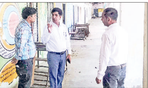
कनीना। स्टॉम रूम एवं डिस्पैच सेंटर का दौरा करते एसडीएम।